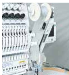
Dispositivo cordel zigzag