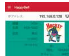
HAPPY BELL Applicazione per dispositivi mobili per monitorare lo stato della macchina