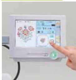
Pannello Touch 999 disegni in memoria 40,000,000 punti di memoria