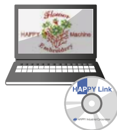
Funzioni di editing e controllo macchine disponibili nel software HAPPY LAN/LINK