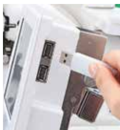
Mouse e USB