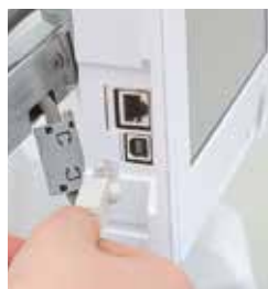
Connessione LAN / USB / WIFI